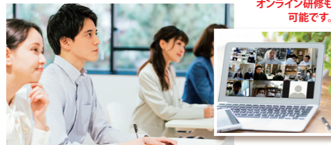
オンライン研修も可能です。

Cコース 月6万6,000円/1名×8回 基本コースに、ほめマガ配信(月2回)と、担当者へのメールフォロー(随時)、タスク管理、経営者または担当責任者に対して月1回のコーチングをおこないます。