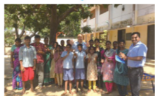
カンボジアに寄付